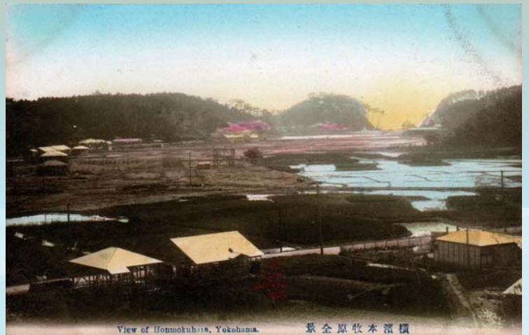
View of Honnokuji, Yokohama.